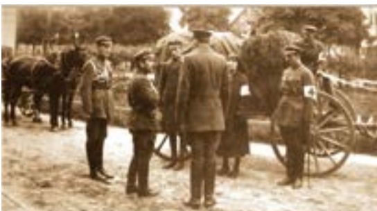
Skubi medicinos pagalba sužeistiesiems fronte (1920 m.).

Nuo susikūrimo 1918 metų pabaigoje iki 1923 metų Sanitarijos skyrius atliko milžinišką darbą. Buvo pasirūpinta daugybe sužeistų ir sergančių karių. Stipriai sumažėjo sergamumas užkrečiamosiomis ir parazitinėmis ligomis: jei 1919 metais šiomis ligomis sirgo 55,3% karių, 1923 metais tokių karių buvo jau tik 8,7%. Įgyvendinę svarbiausius uždavinius, Sanitarijos skyrius 1923 metais susiaurino savo veiklą. Buvo uždaryti lazaretai ir kitos nebereikalingos ligoninės. Visi skyriai perkelti į pagrindines karių gydymo įstaigas. Viena iš tokių įstaigų buvo Karo ligoninė Kaune, kuriai 1926 metais buvo suteiktas dr. Jono Basanavičiaus vardas.